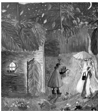
«СТРЕКОЗА И МУРАВЕЙ». РАБОТА Н. СОКОЛЬНИКОВОЙ.