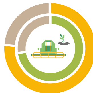
УДЕЛЬНЫЙ ВЕС ОСВОЕННЫХ ЗЕМЕЛЬНЫХ УЧАСТКОВ НЕКОММЕРЧЕСКИХ ОБЪЕДИНЕНИЙ ГРАЖДАН, в % от общего количества земельных участков в объединениях