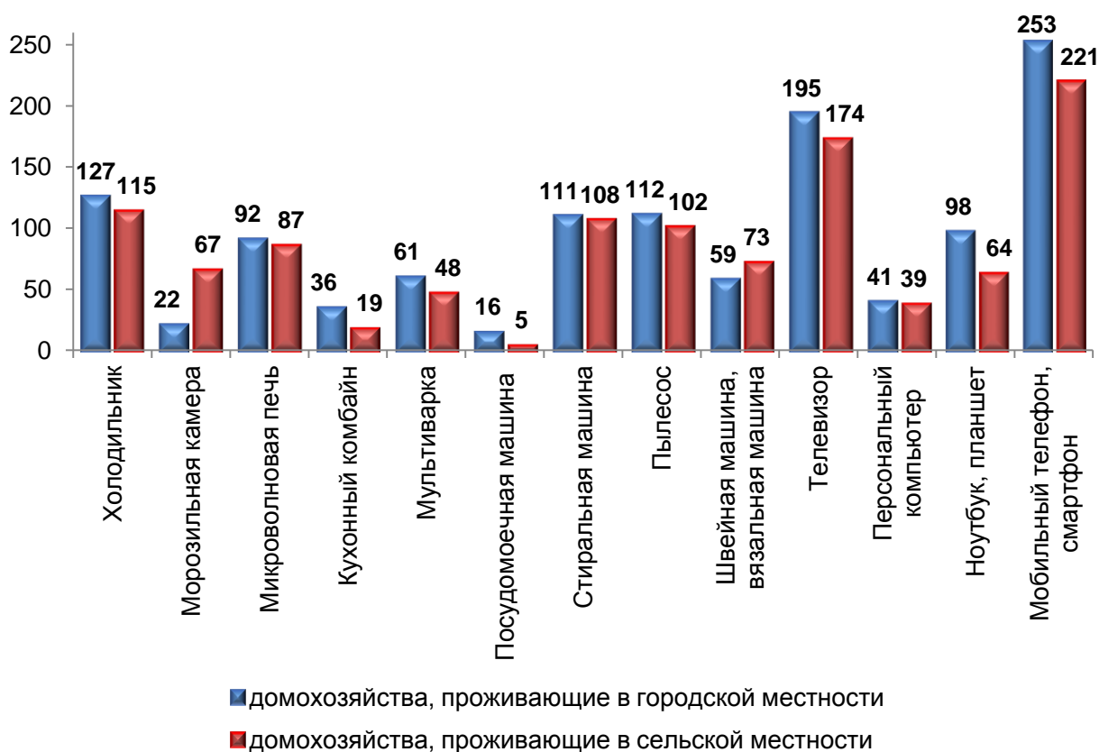
Наличие предметов длительного пользования в домашних хозяйствах в 2022 году (в среднем на 100 домохозяйств, штук)

Подробнее с итогами наблюдения можно ознакомиться на Интернет-портале Кировстата, где создана специальная рубрика, посвященная выборочному обследованию бюджетов домашних хозяйств.