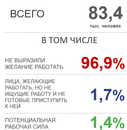
РАСПРЕДЕЛЕНИЕ ЛИЦ, НЕ ВЫРАЗИВШИХ ЖЕЛАНИЕ РАБОТАТЬ, ПО КАТЕГОРИЯМ, %